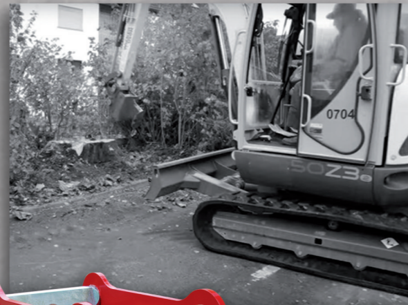
Die Wurzelratte W 6 an einem 5-t-Bagger.