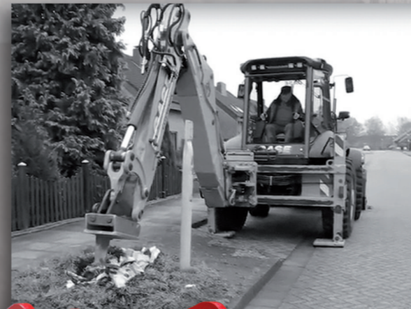
Die Wurzelratte W 12 an einem 8-t-Bagger.