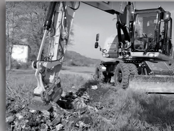
Die Wurzelratte W 20 an einem 16-t-Bagger.