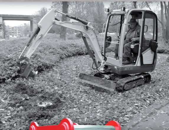
Die Wurzelratte W 2 an einem 1,8-t-Minibagger.